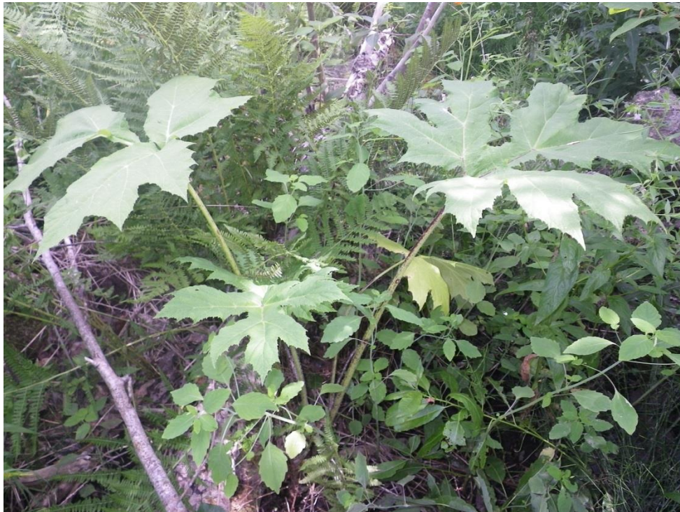
Figure 3. Berce du Caucase dans un secteur marécageux à Trois-Pistoles

Interventions : Les 40 plants observés ont été éliminés par extraction à la racine en date du 16 mai. Une 2 e phase d'intervention a été effectuée le 1 er août. Un plant en fleur a alors été éliminé. Les fleurs ont été récoltées et ensachées. Aussi, 8 plants repérés ont été éliminés. Aucun autre plant n'a été observé sur le site. La présence de plants de berce laineuse est notée en bordure du secteur marécageux, au nord-est.