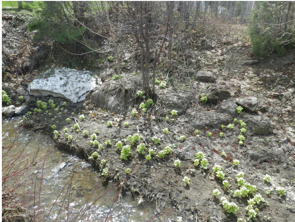
Figure 4. Vue d'ensemble de la colonie de Notre-Dame-des-Neiges– 14 mai