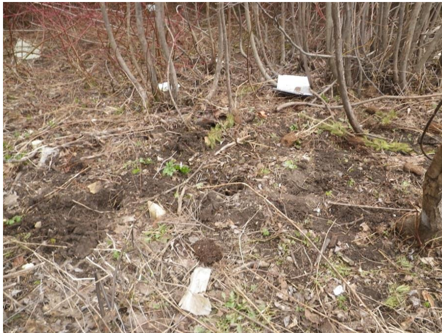
Figure 2. Interventions de contrôle en milieu boisé à Saint-Guy – phase 1

Interventions : En date du 16 mai 2018, des travaux d'extraction à la racine ont été effectués par l'OBVNEBSL. Les 35 plants détectés ont été éliminés. Une deuxième phase d'intervention a été effectuée le 30 juillet pour s'assurer de l'absence de plants matures. Un individu en fleur situé derrière un garage a été éliminé. Ses fleurs ont été récoltées et ensachées. Aussi, 8 plants repérés ont été éliminés par extraction à la racine. Aucun autre plant de berce n'a été observé sur le site.