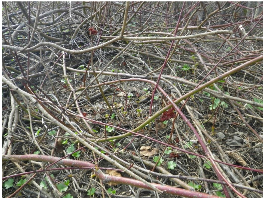
Figure 5. Nombreux plantules dissimulés parmi les cornouillers

Une deuxième phase d'intervention et de suivi, réalisée le 2 août, a permis d'éliminer par extraction à la racine 10 plants épars restant. Aucun plant n'a été repéré dehors du site traité.