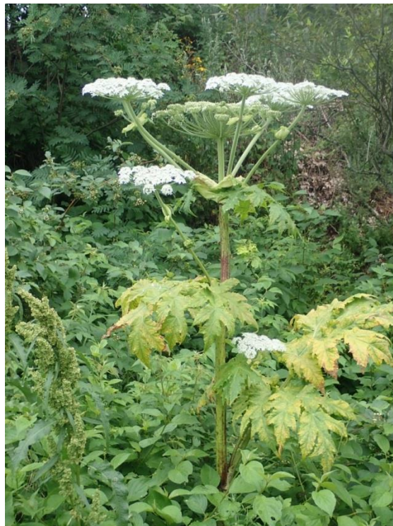
Figure 6. Plant de berce du Caucase mature à Sainte-Blandine - 2 août

Une deuxième phase d'intervention réalisée le 2 août a permis de localiser et d'éliminer environ 60 plants épars sur le site. Un seul plant mature en fleur a été éliminé. Les ombelles de fleurs ont été récoltées et ensachées. Aucun autre plant n'a été observé sur le site lors de ce suivi. Un suivi réalisé sur la petite parcelle traitée au glyphosate indique un succès de l'opération puisqu'aucun plant de berce n'était présent.